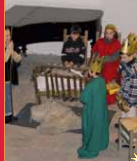
Traditionelles Krippenspiel mit der Kirchgemeinde Themar