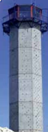
neuer Aussichtsturm (1001,125 m)

Skiwanderung ab Oberhof – Rondell – Rennsteig – Großer Beerberg – Schneekopf – Schmücke – Gehlberg (ca. 13 km), zurück nach Oberhof mit dem Zug ab Bahnof Gehlberg oder Rennsteiglinie ab Schmücke und Schneekopf